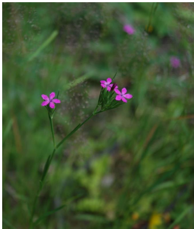
Rys. 1. Goździk kosmaty Dianthus armeria – roślina ściśle chroniona. Fig. 1. Deptford pink Dianthus armeria – strictly protected plant.

Prawie 70 lat później Pelc [1967], badający florę naczyniową Pogórza Cieszyńskiego, potwierdził występowanie omawianego gatunku rosnącego na suchych murawkach na Górze Tuł. Ponadto odnotował Dianthus armeria na terenie Góry Jasieniowa na osypiskach w starych kamieniołomach. Na tych samych siedliskach na terenie Góry Jasieniowa podał Dianthus armeria Buława [1976], badający roślinność wyrobisk powapiennych Pogórza Cieszyńskiego. Ponadto odnalazł Dianthus armeria na terenie czynnego do dnia dzisiejszego wyrobiska wapieni cieszyńskich w Lesznej Górnej zlokalizowanego w obrębie Góry Tuł. Do nowszych notowań Dianthus armeria z terenu Pogórza Cieszyńskiego należą informacje z ostatniego dziesięciolecia XX wieku [Wilczek i in. 2001]. Celem niniejszej pracy była aktualizacja listy stanowisk gatunku Dianthus armeria na terenie Pogórza Cieszyńskiego.